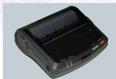
※ プリンタはオプションです。 Printer : Option